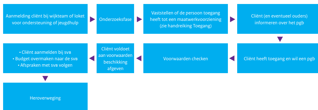
Figuur 2.1 – Procesbeschrijving toekennen en handhaven pgb